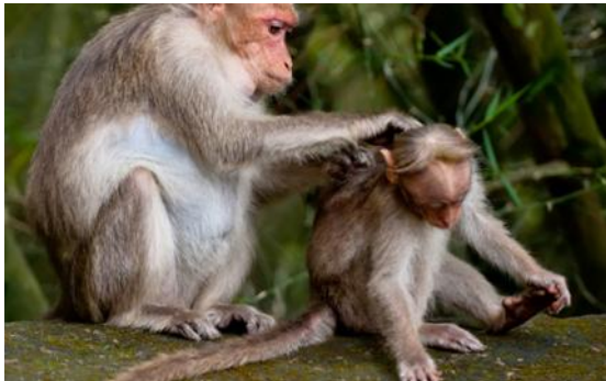
الدفء و الاحساس بالامان