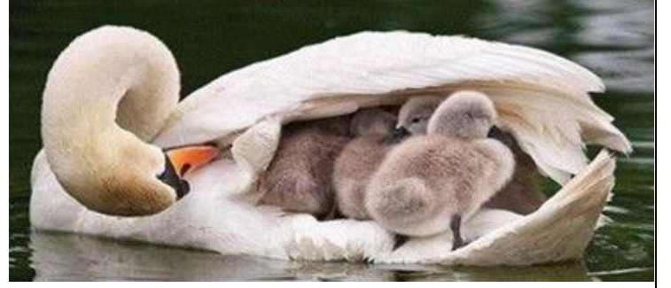
الدفء و الاحساس بالامان