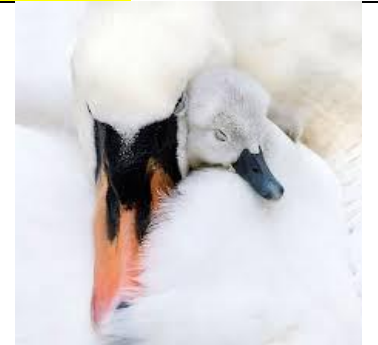
الدفء و الاحساس بالامان